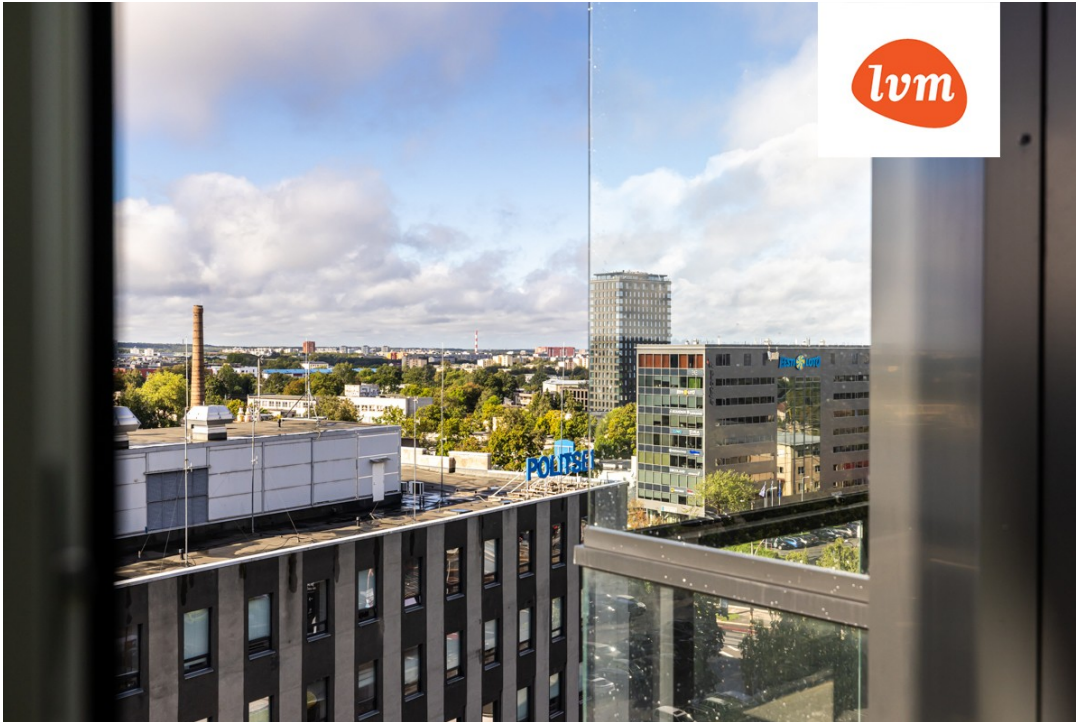
Pärnu mnt 137