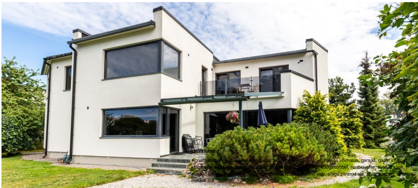
Maja, Jõeoti 37