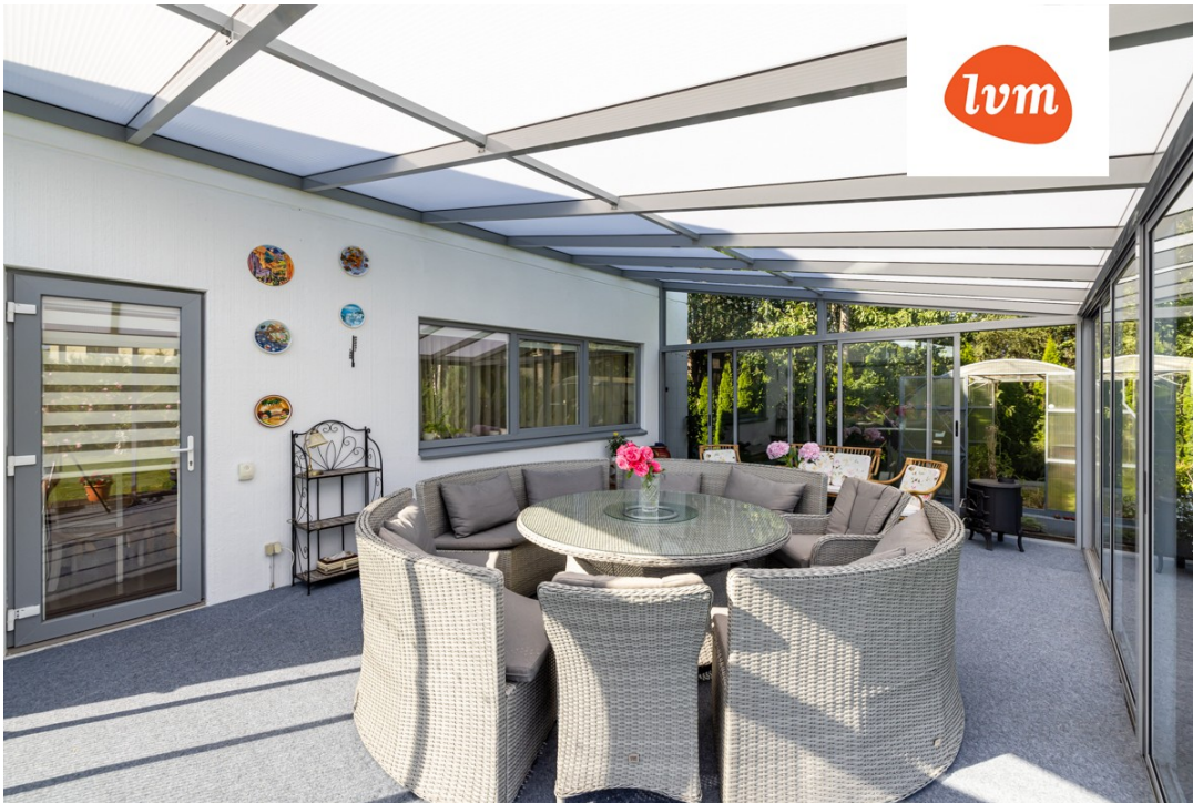
Kepsu tee 1 I korrus