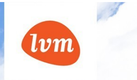
Vabaõhumuuseumi tee 50a Soklikorrus