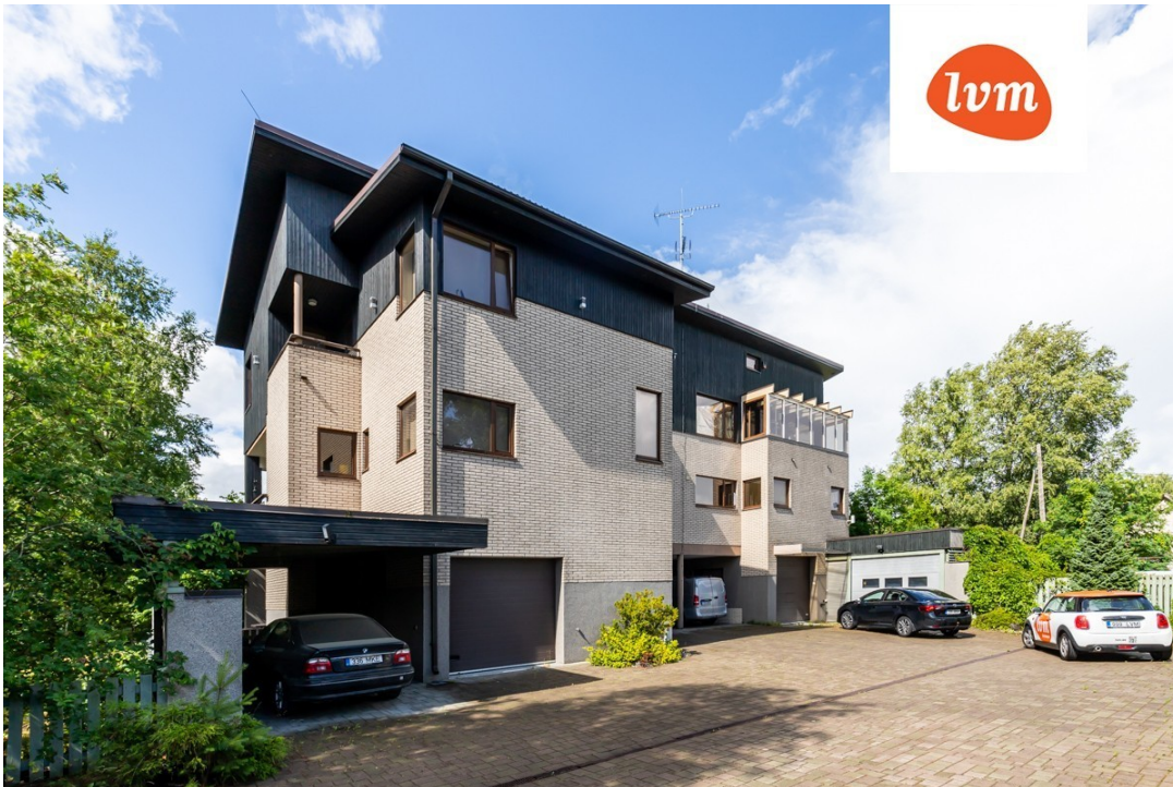
Vabaõhumuuseumi tee 50a Soklikorrus