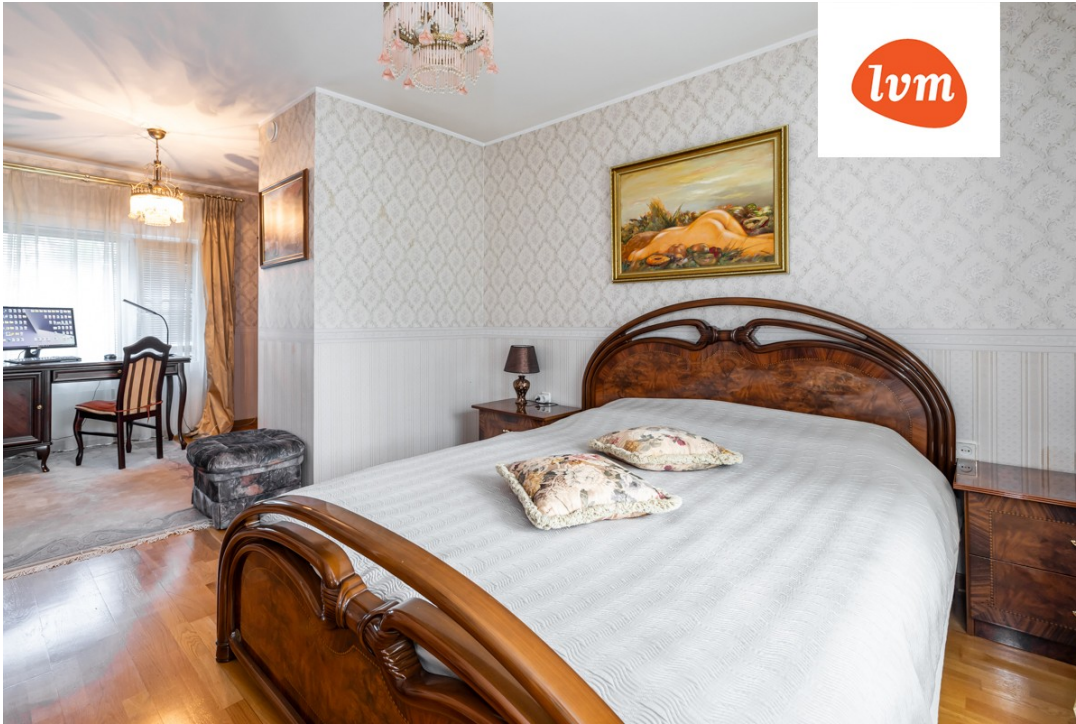
Jääraku tee 73 I korrus