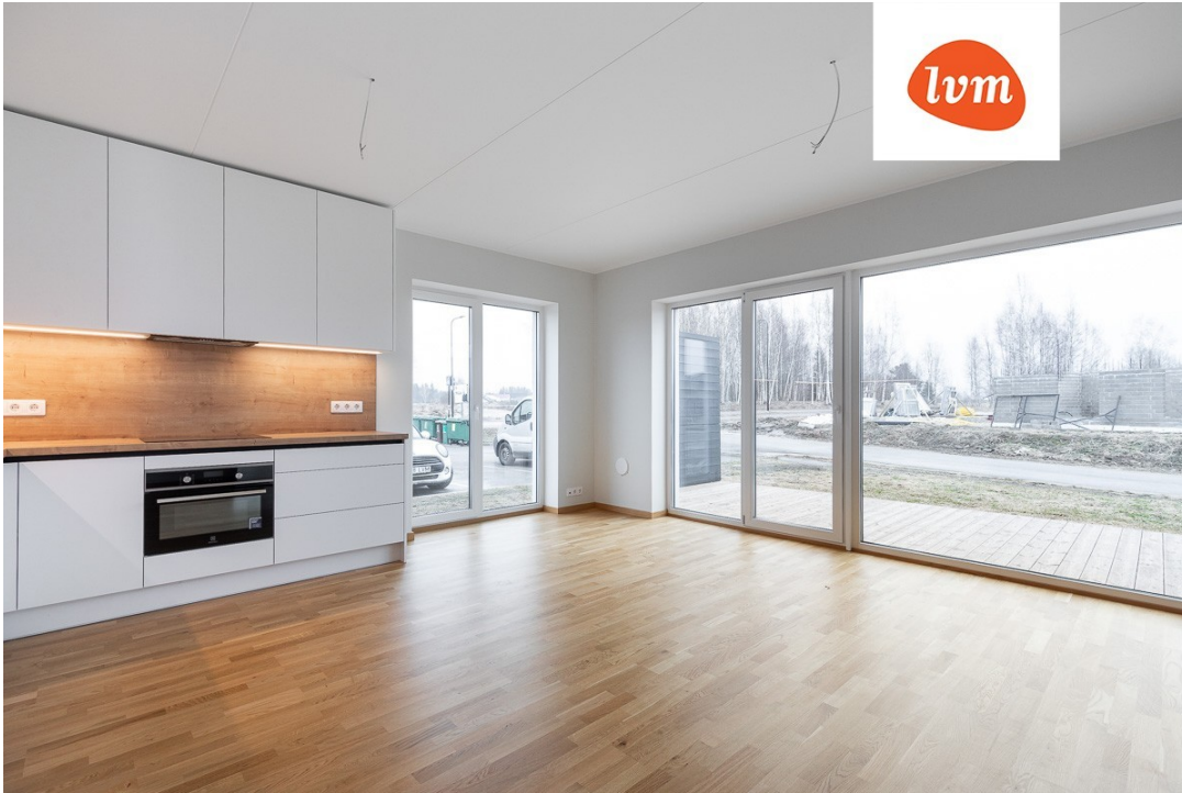
Pihlaka 24-8 I korrus