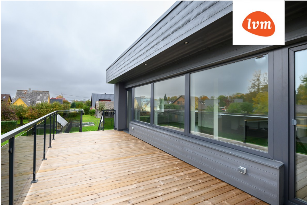
Pärja 6a Pärnu I korrus