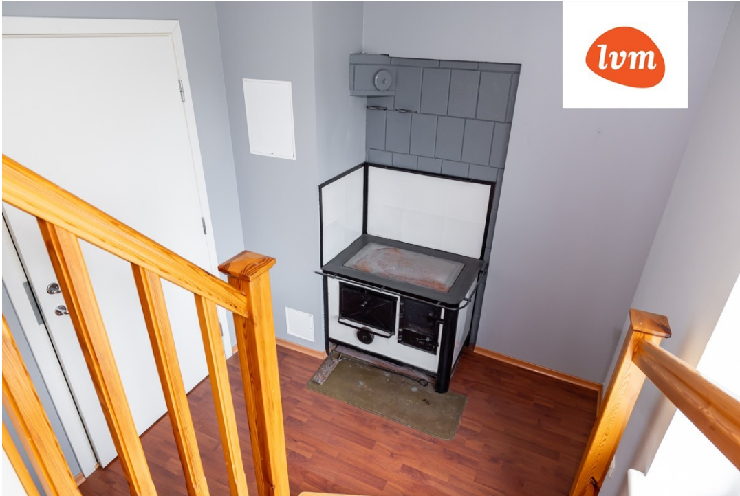
Tallinna 49 katusekorrus