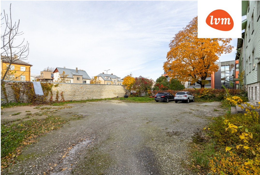
J. Kappeli 3/2 I korrus