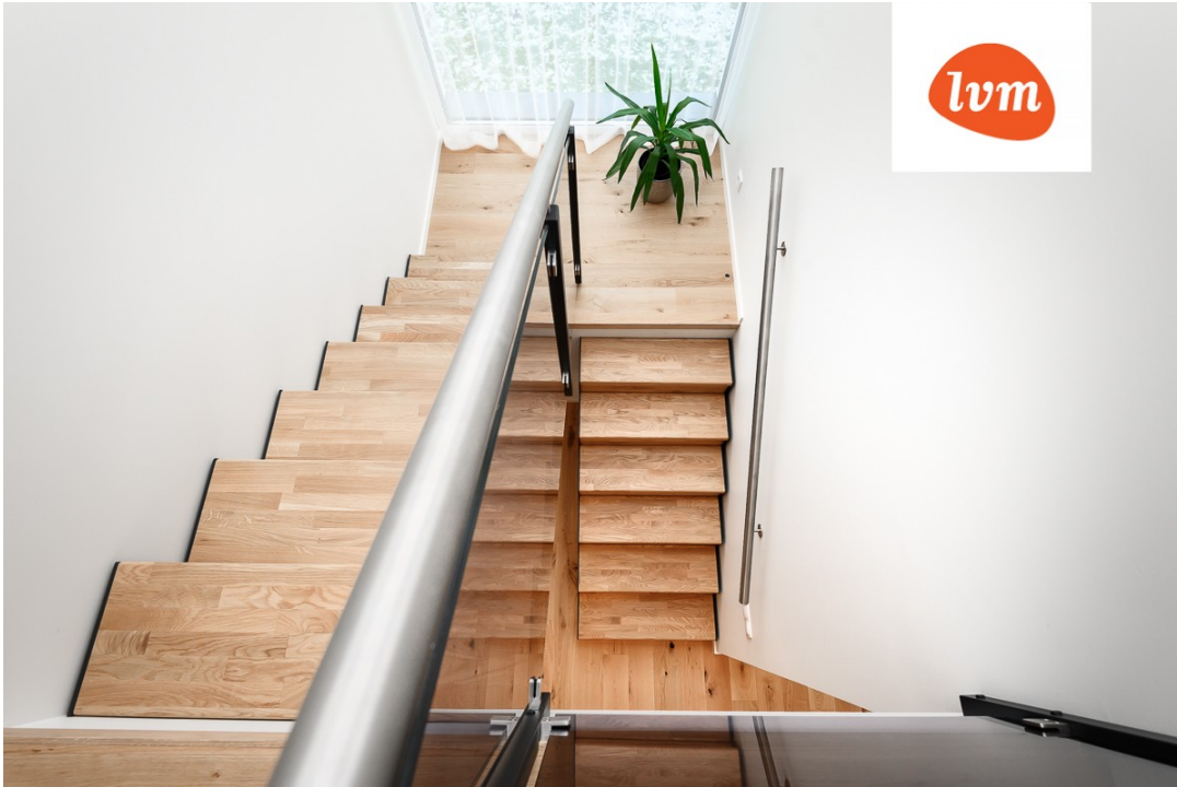
Lembitu 15b II korrus