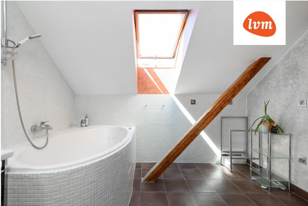
Karusselli 9-3 III korrus