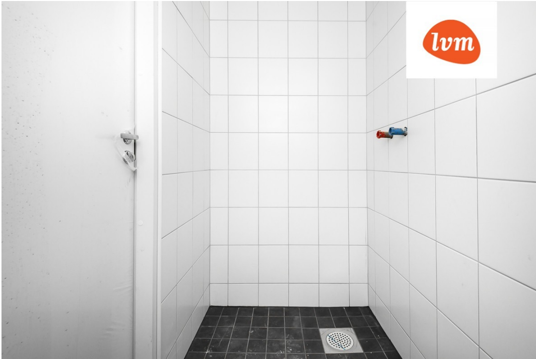
Savi tn 34