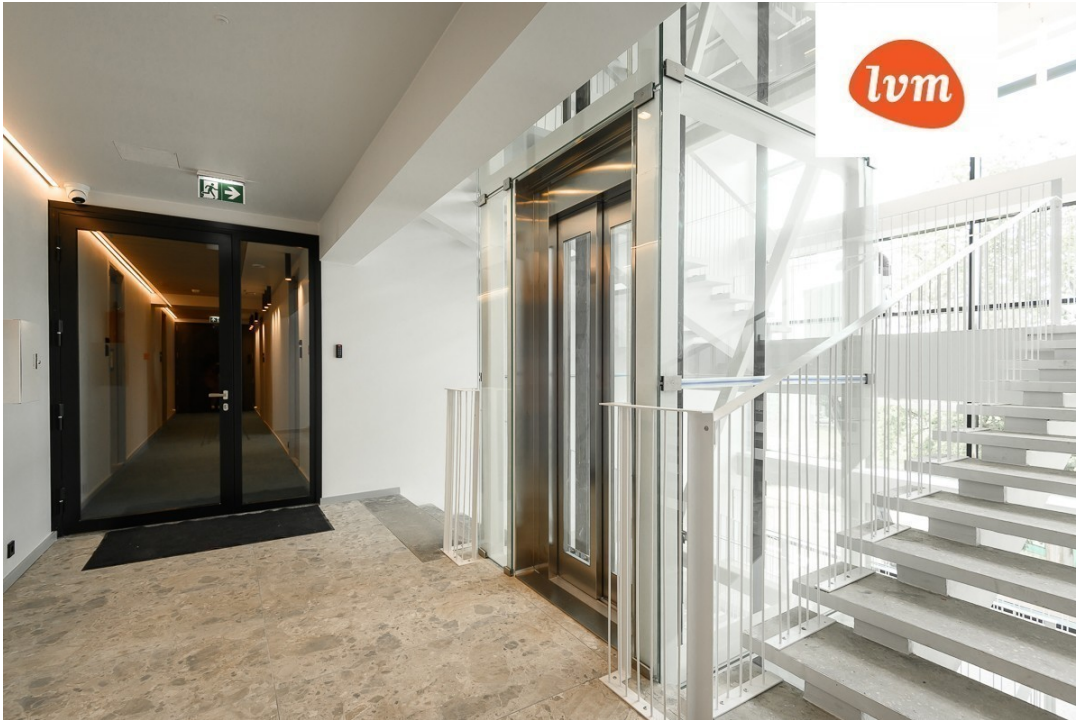
Esplanaadi 10-21A 31,5 m 2