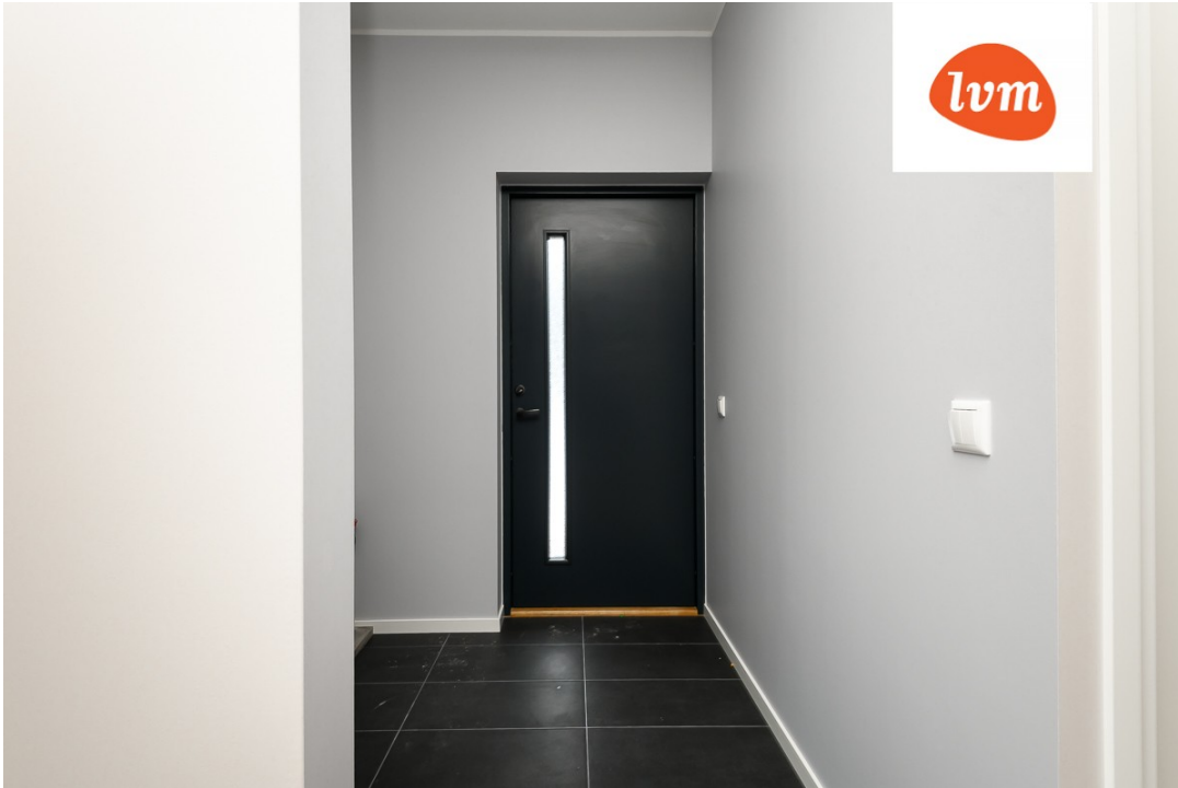
Kavaru vkt 4