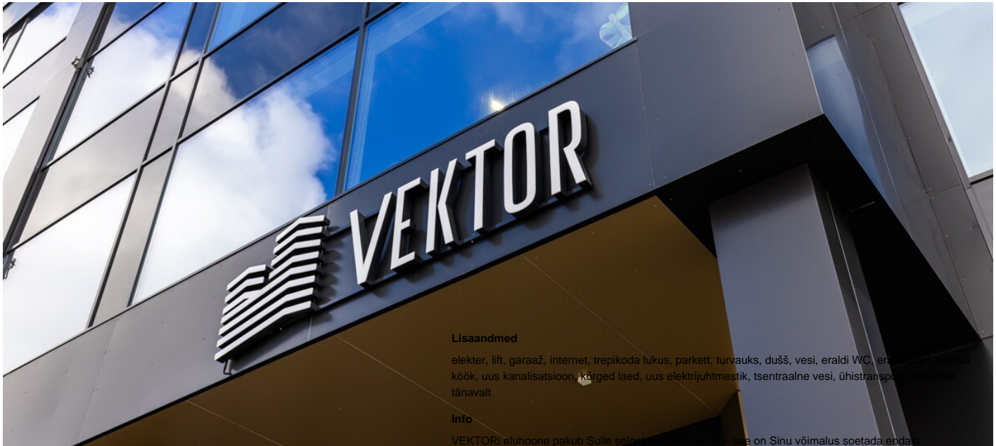
Korter, Pärnu mnt 137