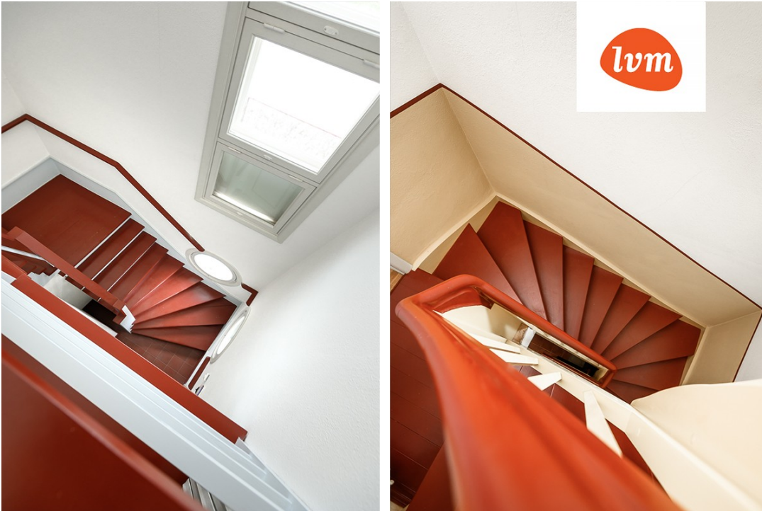
Kuuse 2 II korrus