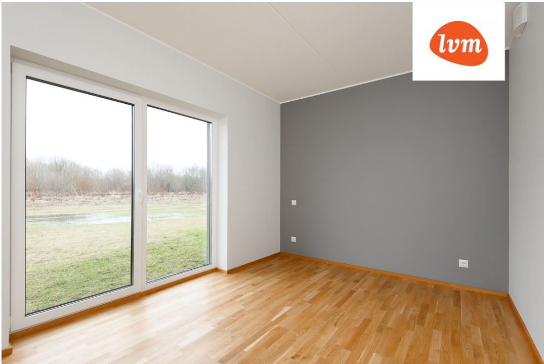
Hirvela 13 Korter 5, 3 tuba, 67,9 m 2