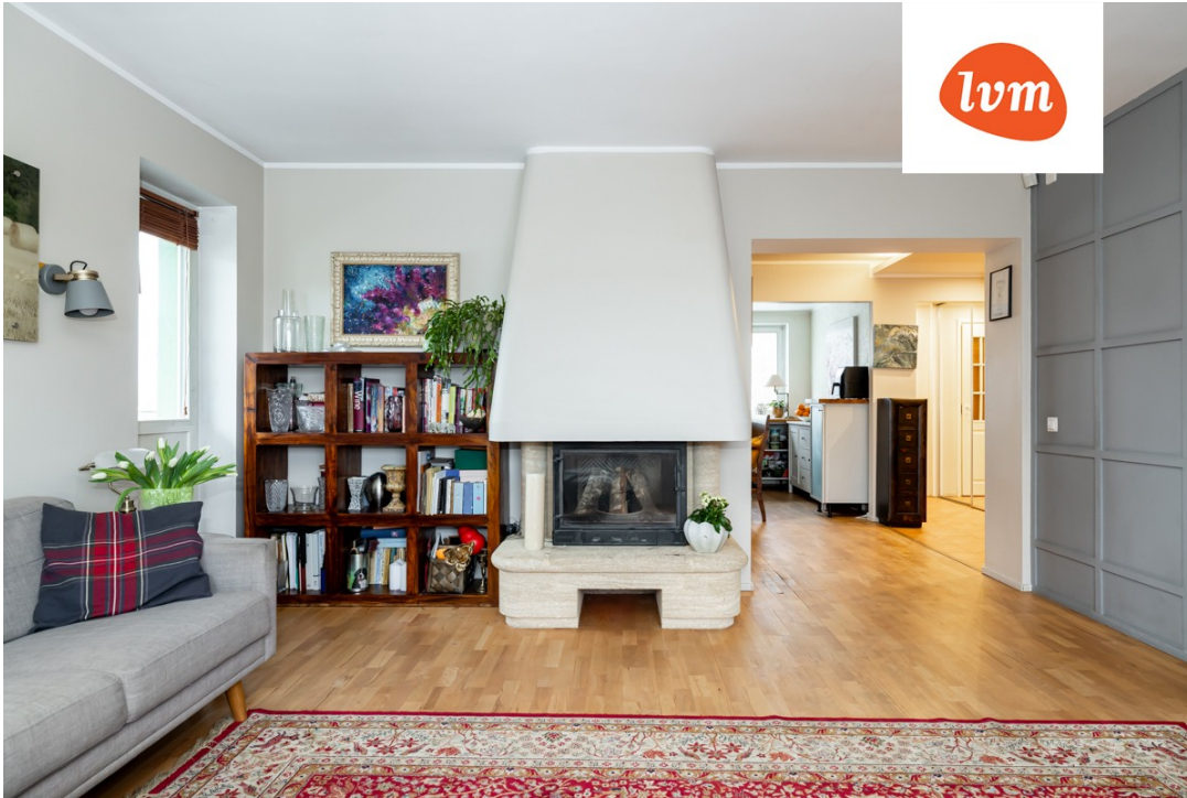
Kaluri tee 4 Põhikorrus