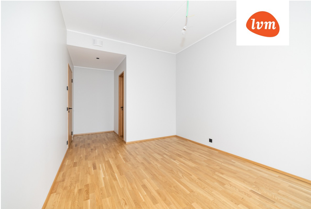
Välja tänav 1/2 Korter 1