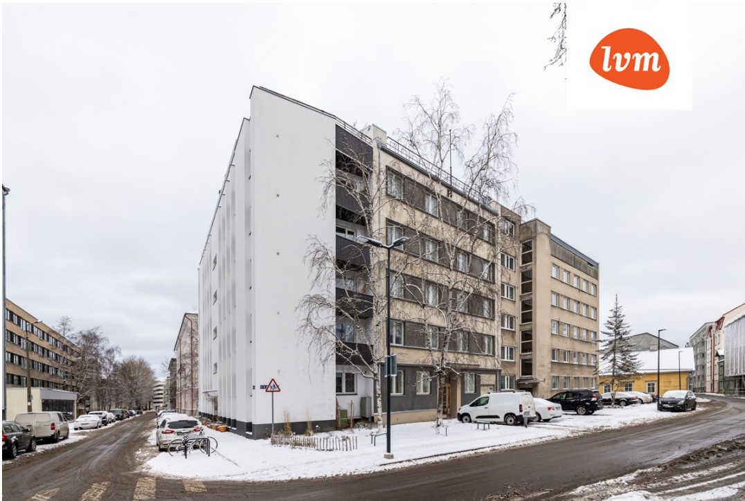
F. R. Faehlmanni tn 17