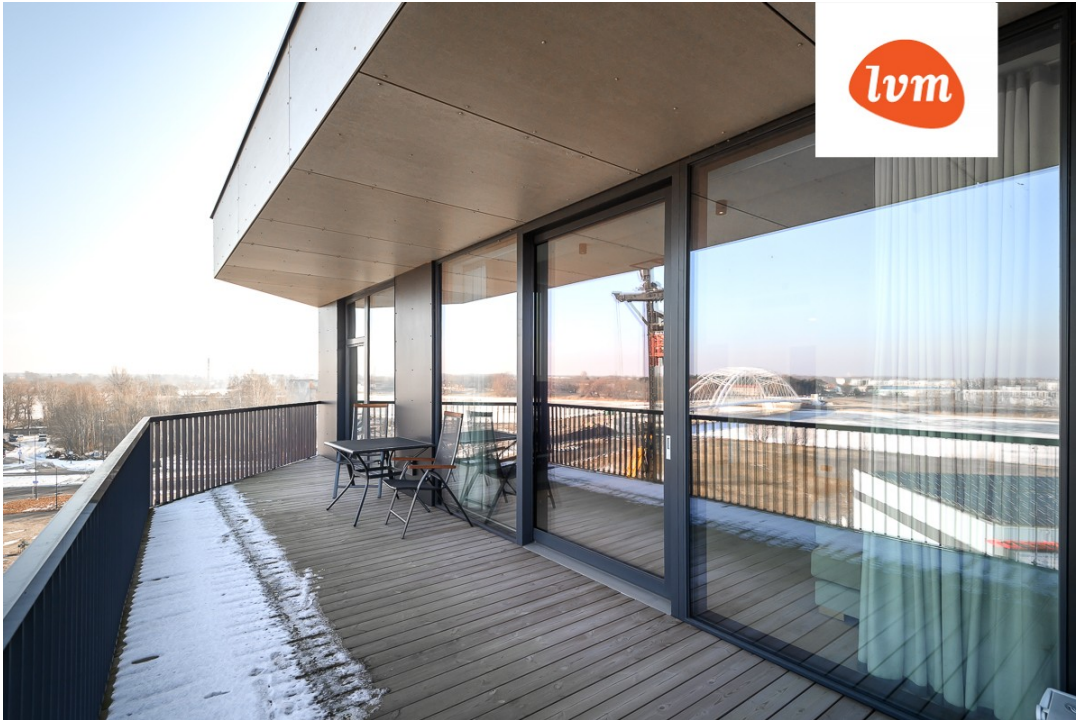
Lai 15a Pärnu