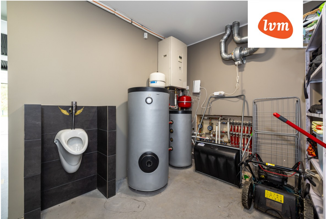
Alu 16 Kose