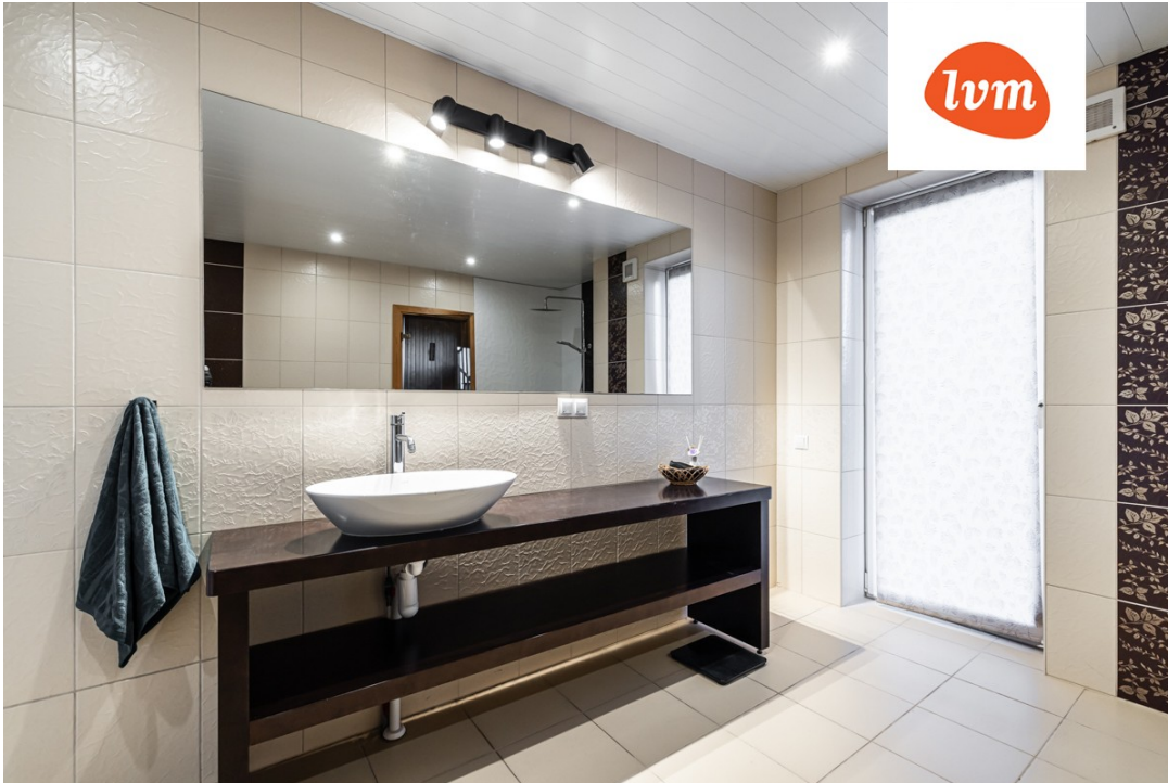
Jõhvika 27 II korrus