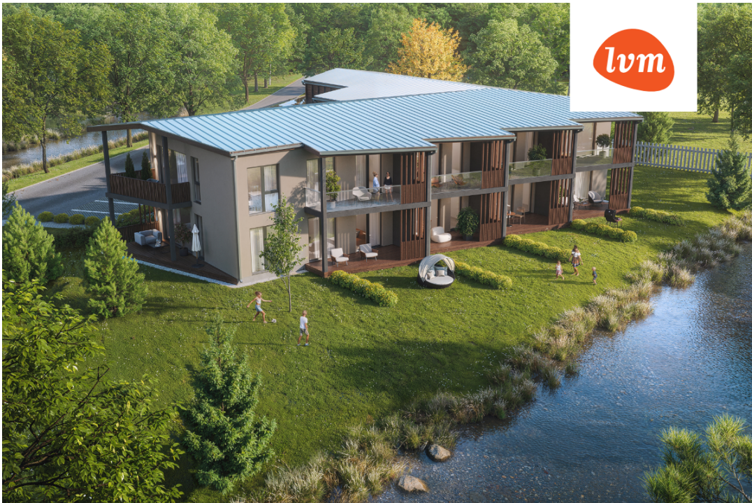
Ülejõe 4, Rapla Korter 2