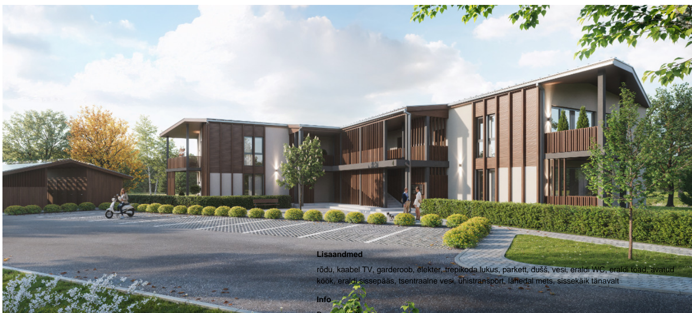
Korter, Ülejõe tn 4