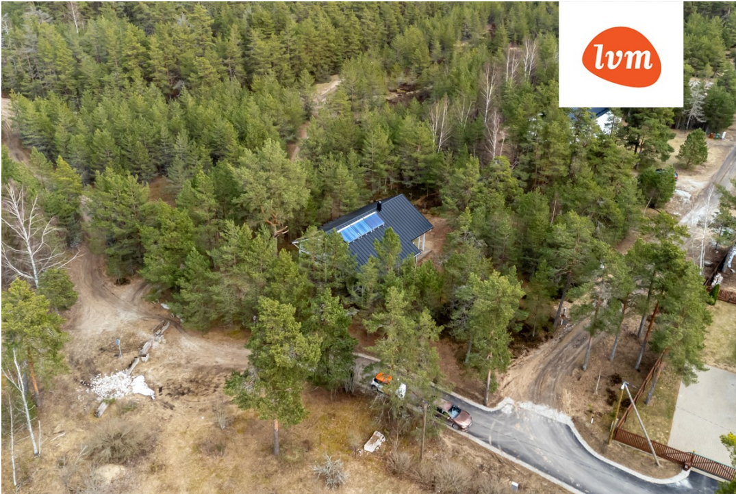
Kuldre tee 1 I korrus