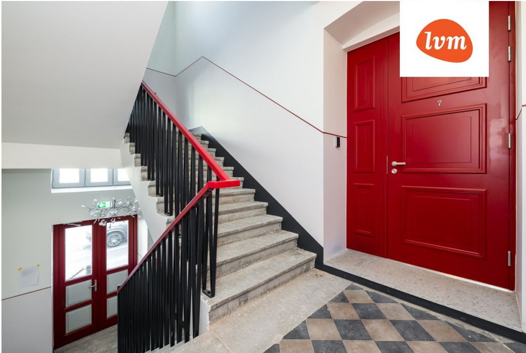
Tartu mnt 64