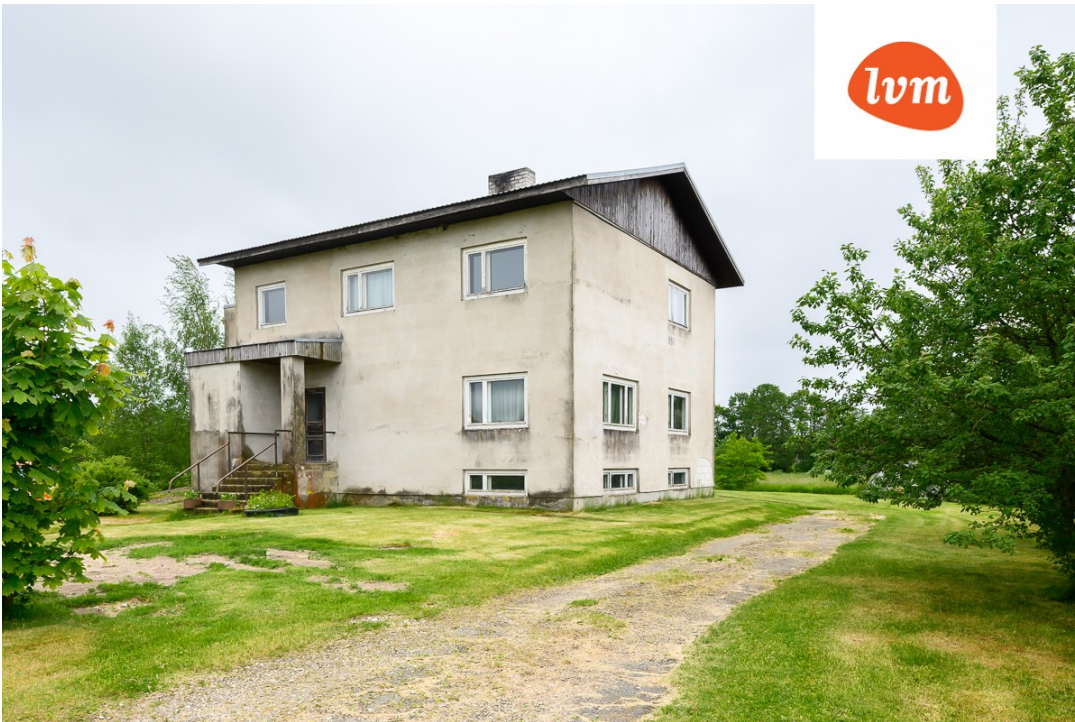
Jaama tee 20 I korrus