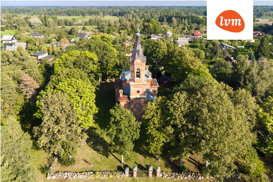
Briisi tee 14 Tahkuranna I korrus