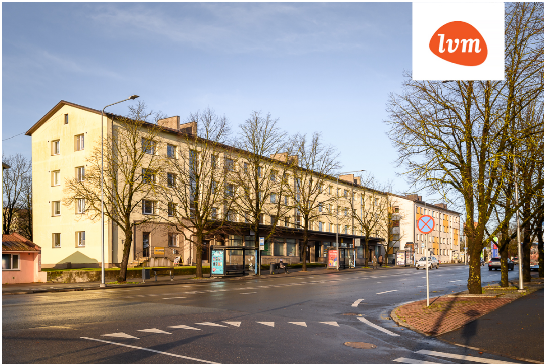
Tallinna mnt 2