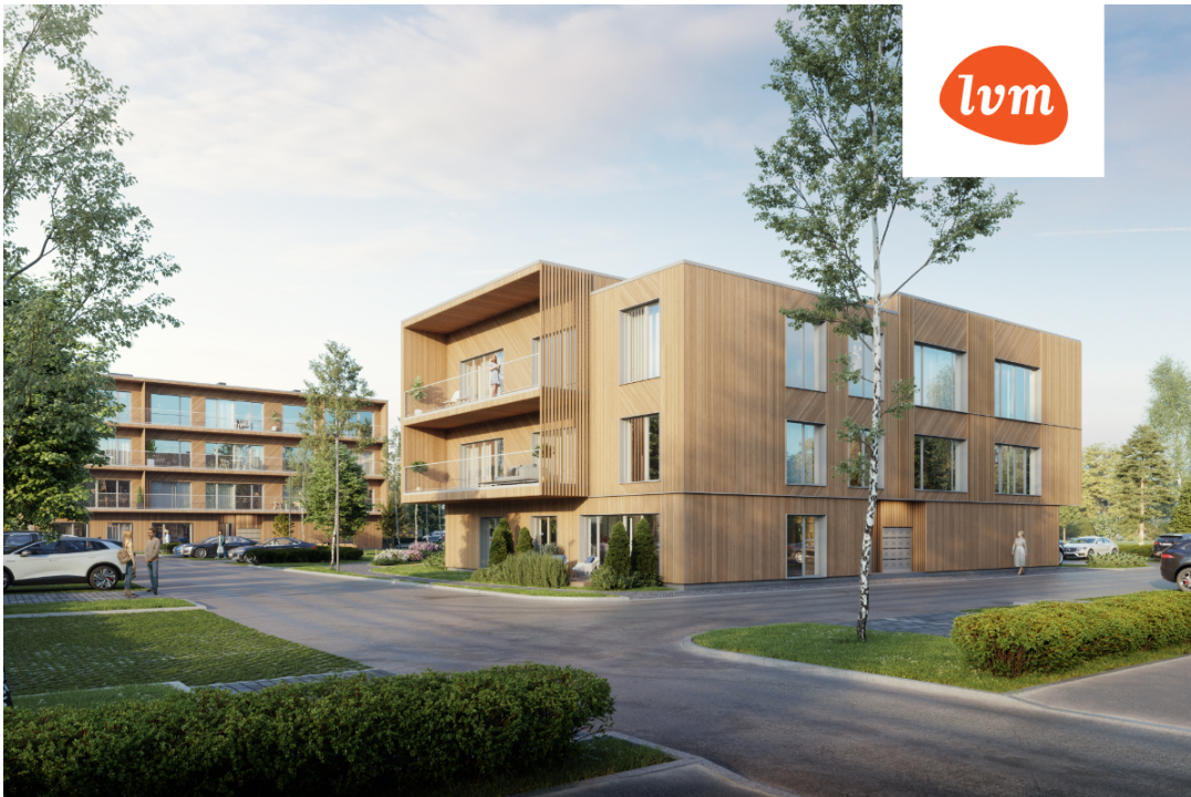
Pärnade pst 7 Korter 10