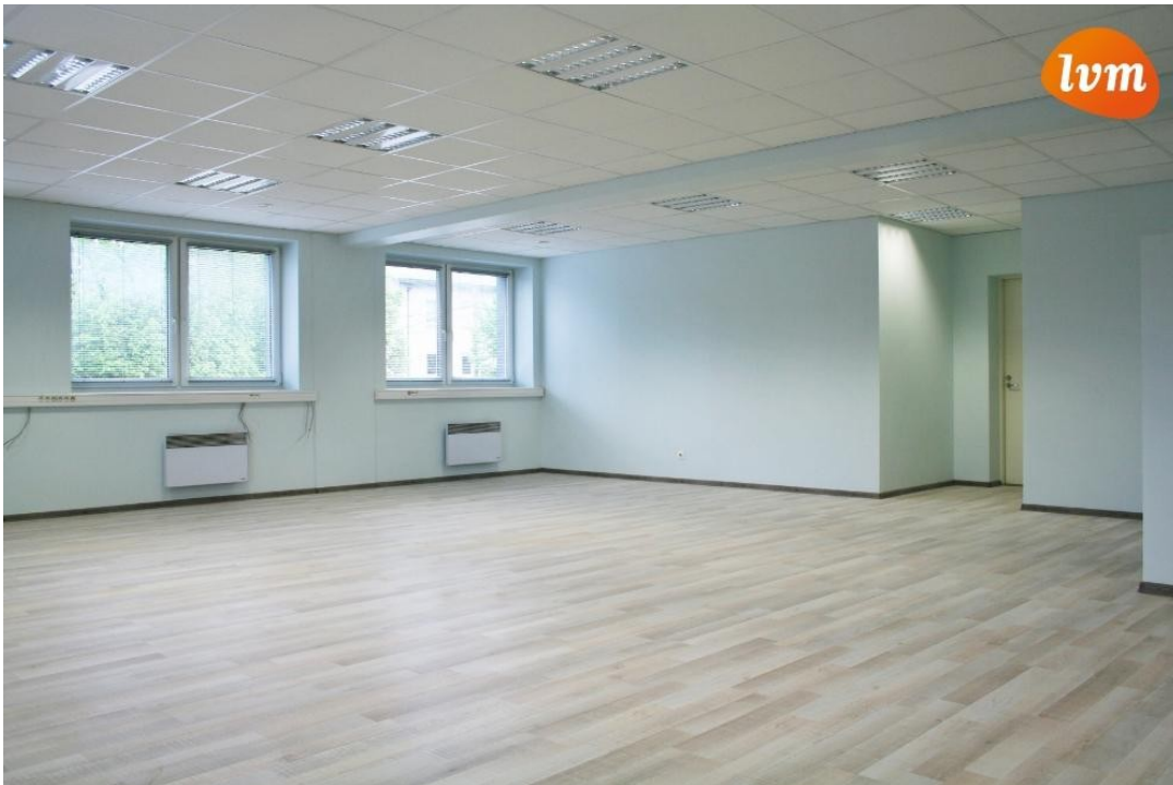
???????????????? (????), Jannseni 26