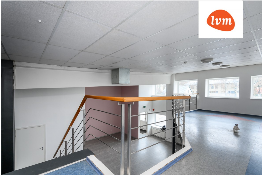
Karja 4/1 II korrus