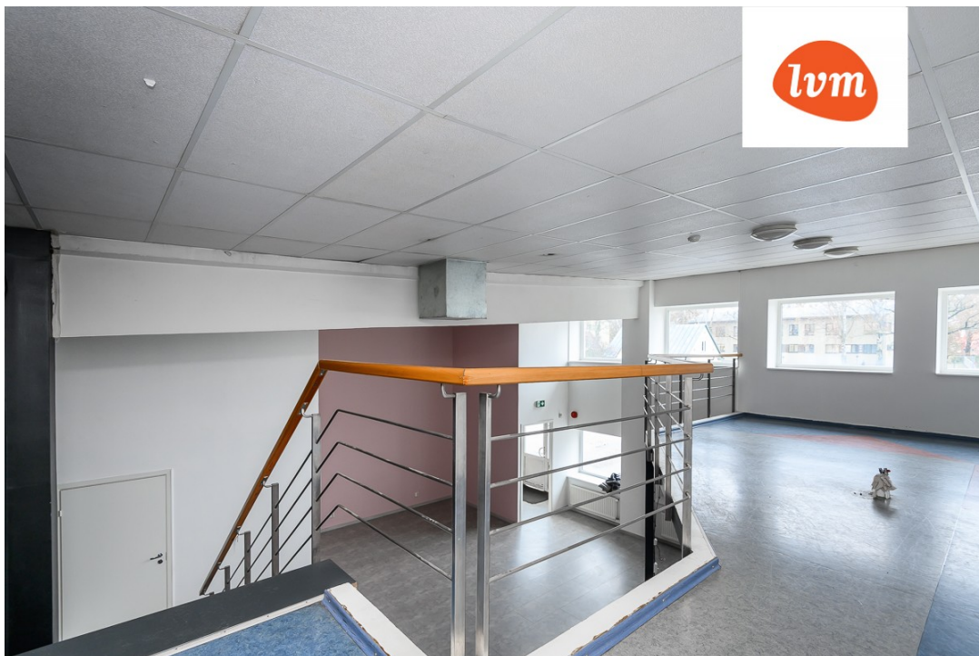
Karja 4/1 II korrus