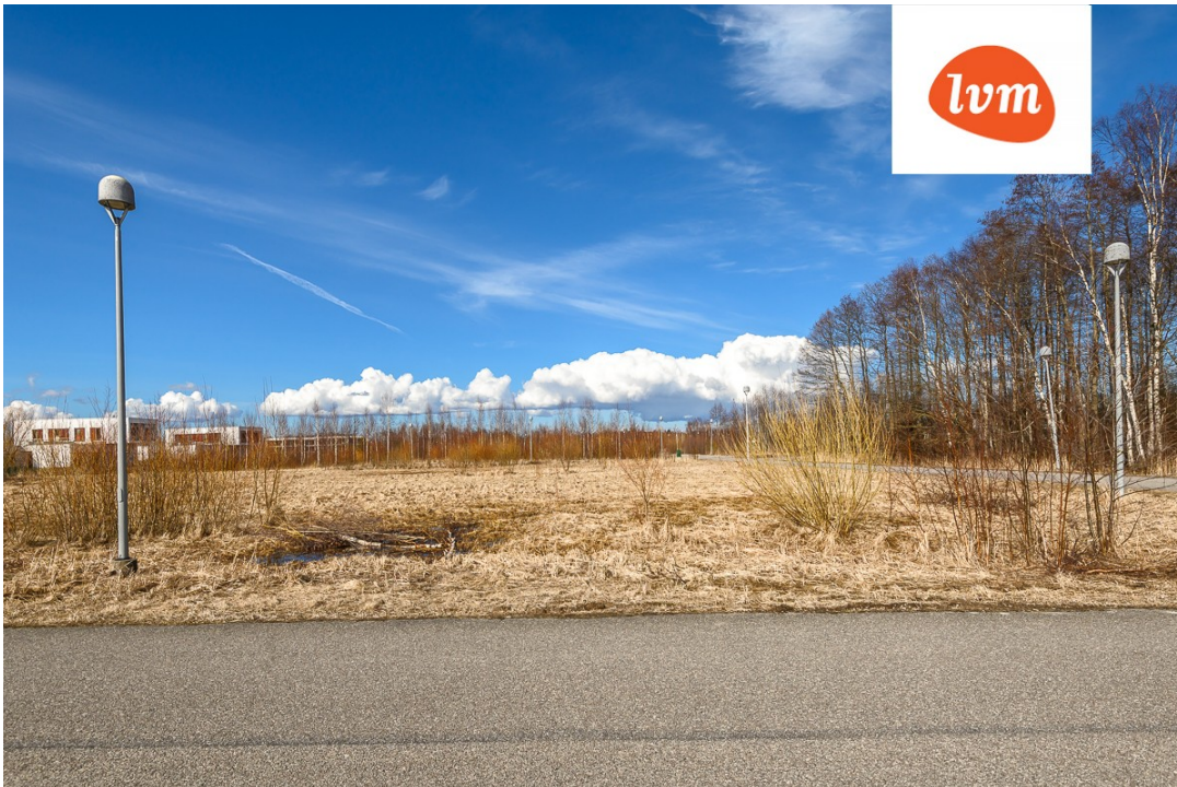
????? ??????????, Ristiku tee 15