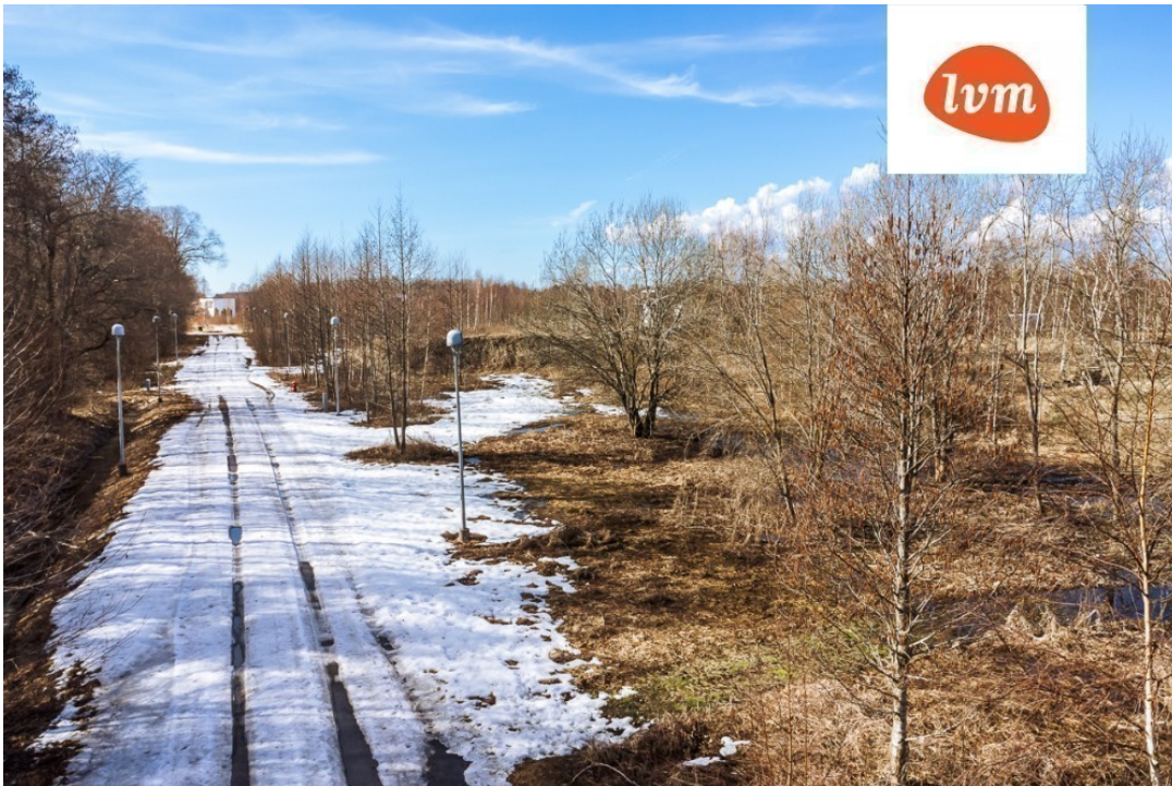
????? ??????????, Ristiku tee 4