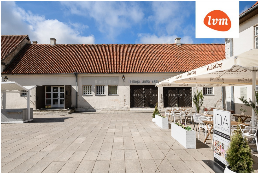
???????????????????? (????????????????), Tallinna 3