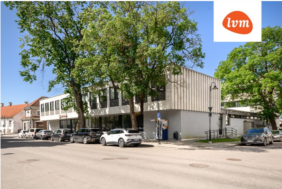
????????????? ?????? (????), Komandandi 6