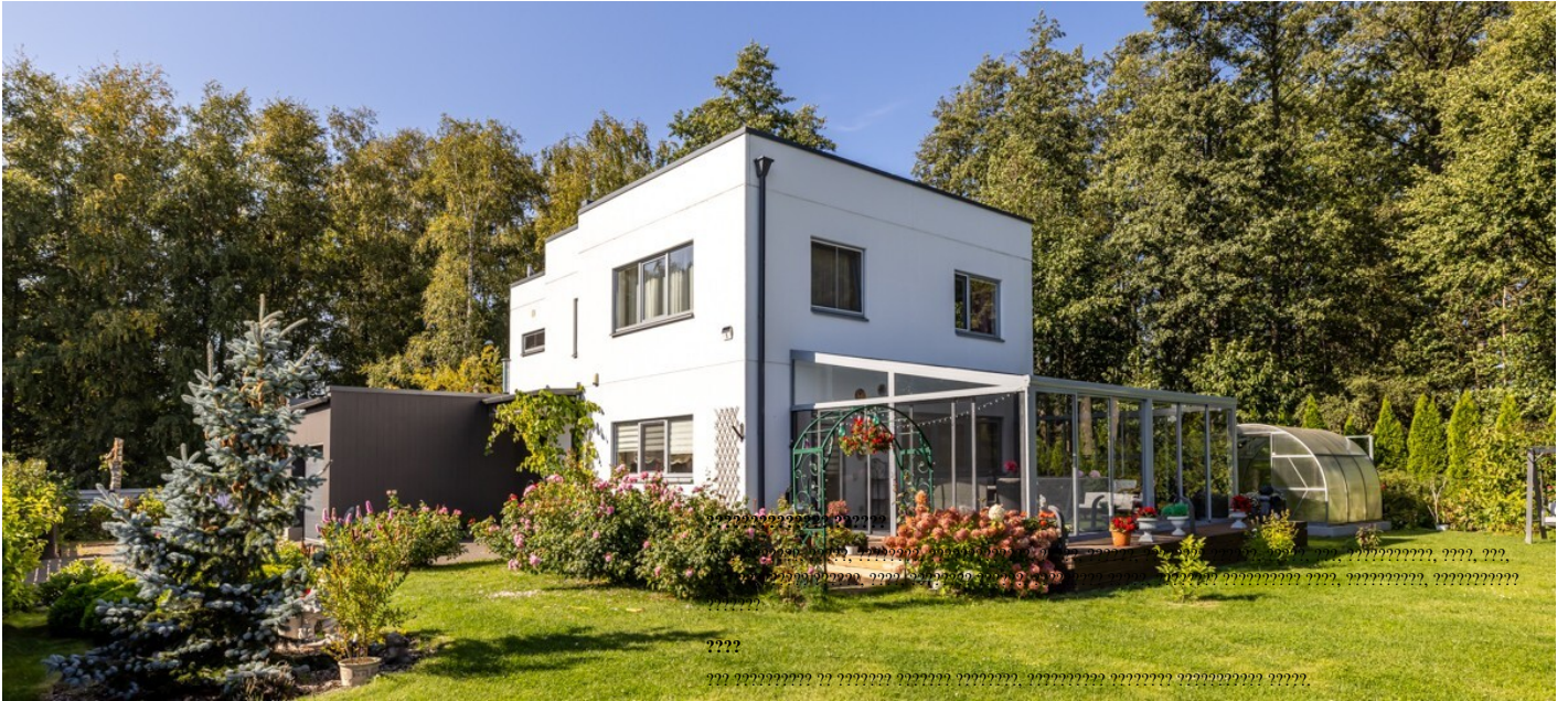
???, Kepsu tee