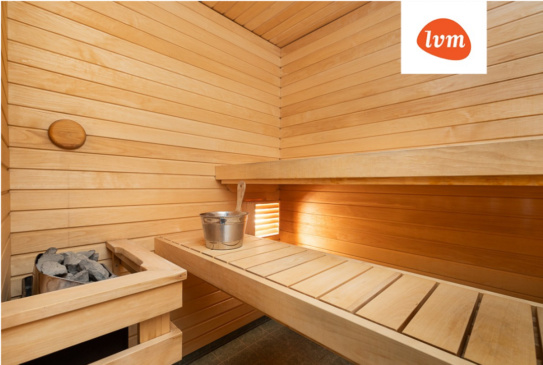
Koovitaja 1 I korrus