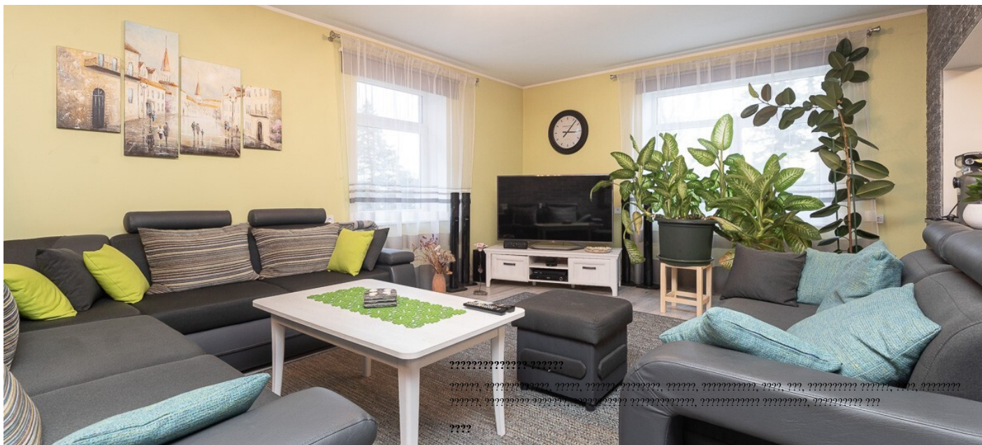
???, Äksi tee 5