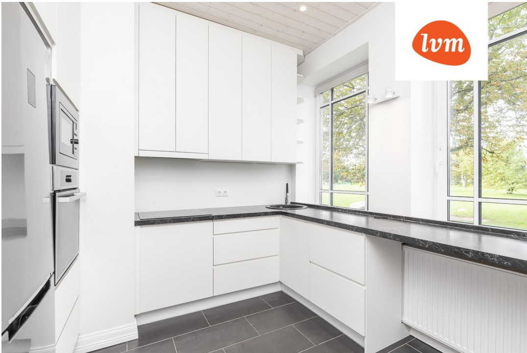
????????, Oja tee 11