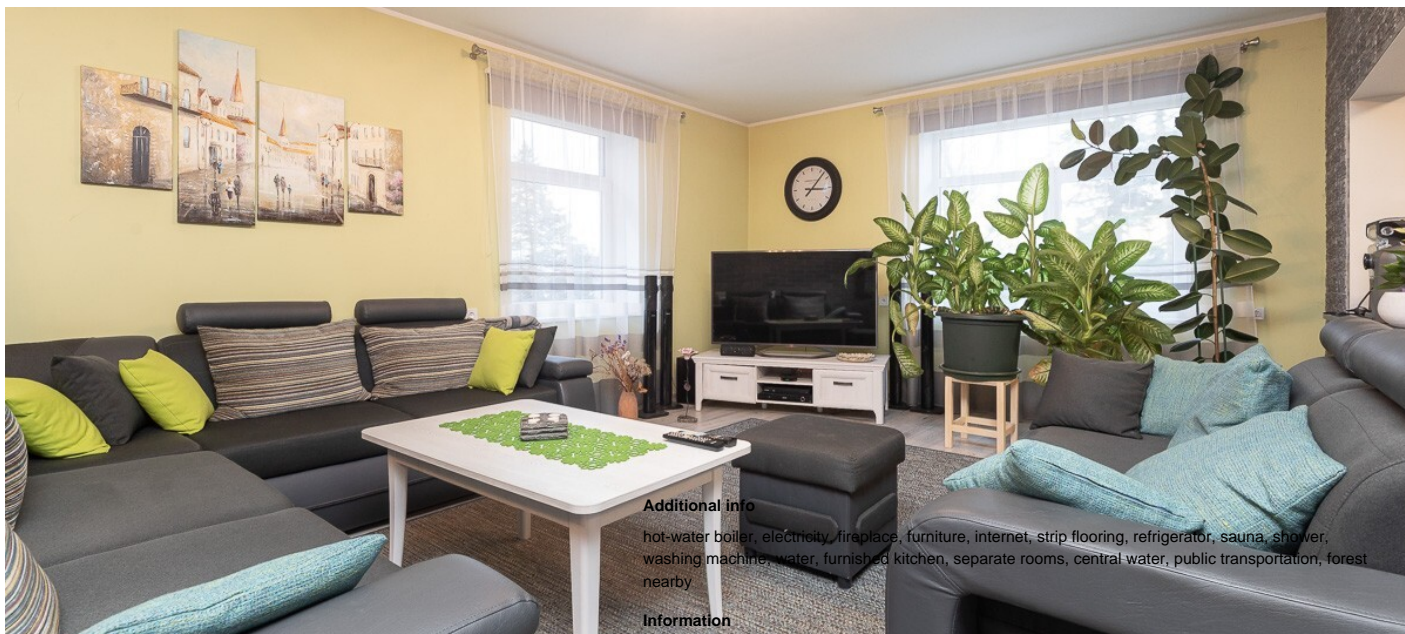
House, Äksi tee 5