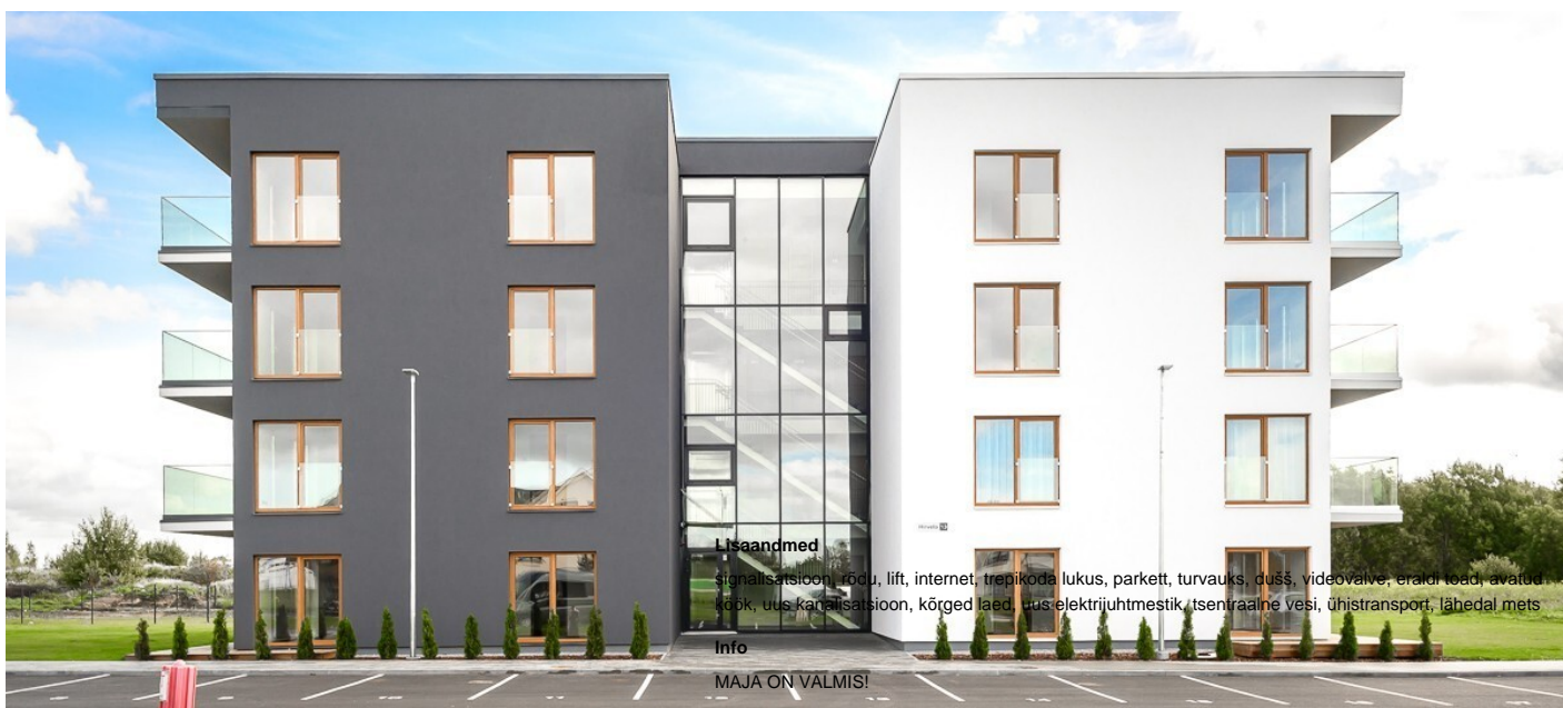
Korter, Hirvela 13

Uus A-energiaklassiga kodu Pärnu linna piiril. Soodsad laenu tingimused. Intress on kaheksa aastaks 12,90% €