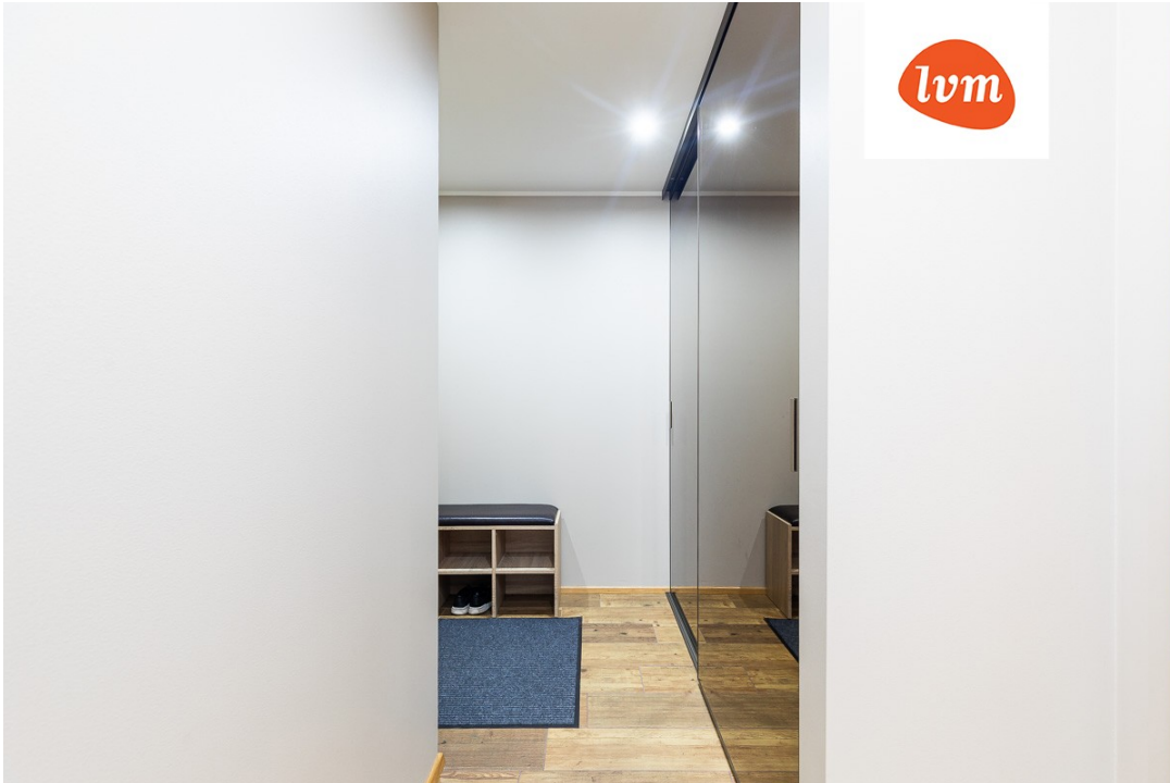
Pillikoori tee 3/1