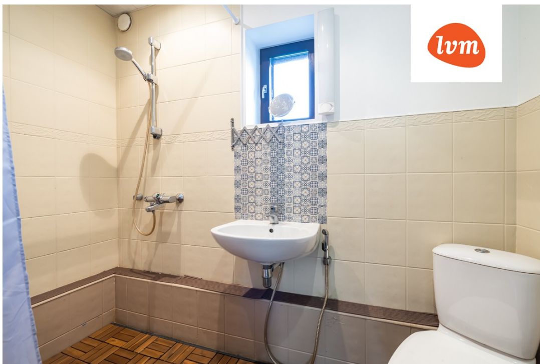
Veerenni põik 3 II korrus