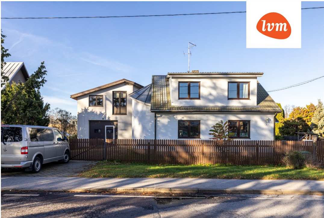
Veerenni põik 3 I korrus