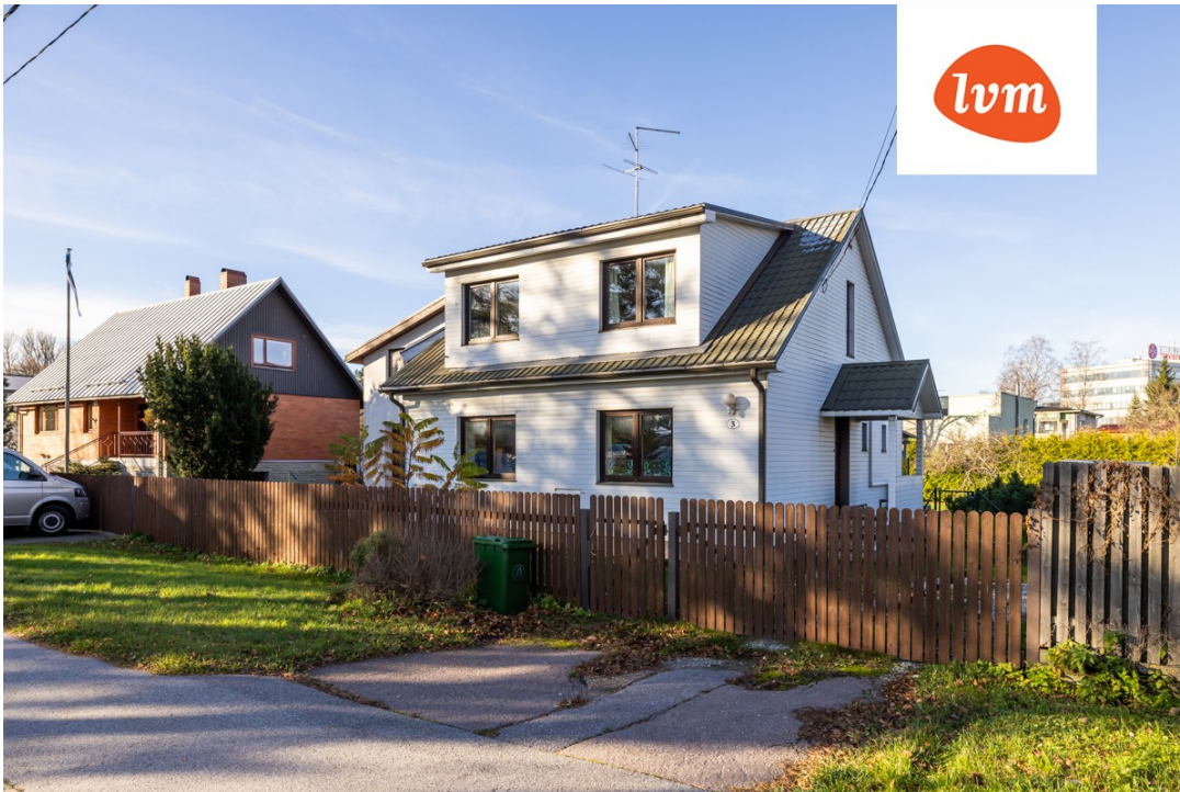
Veerenni põik 3 I korrus