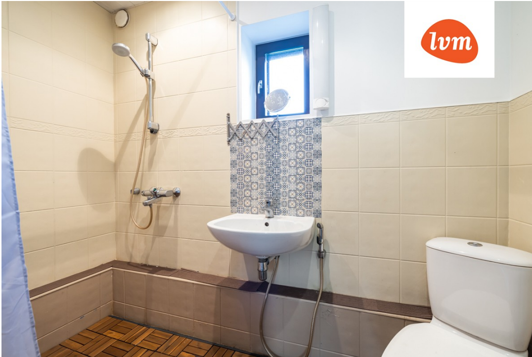
Veerenni põik 3 II korrus