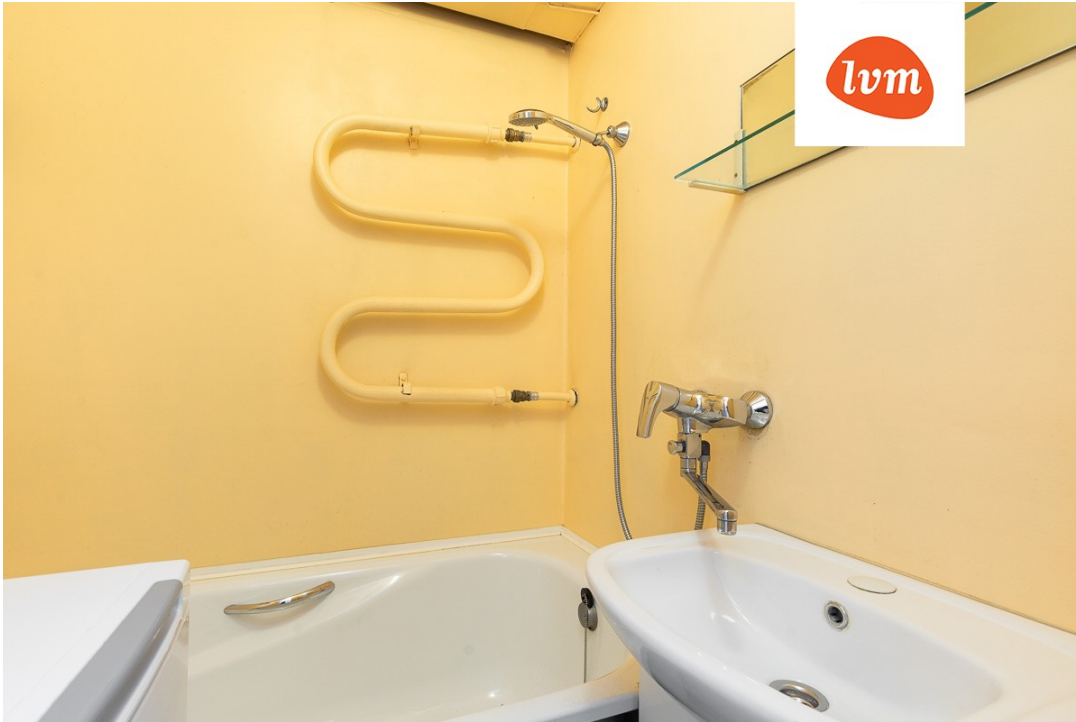
Sõpruse pst 1