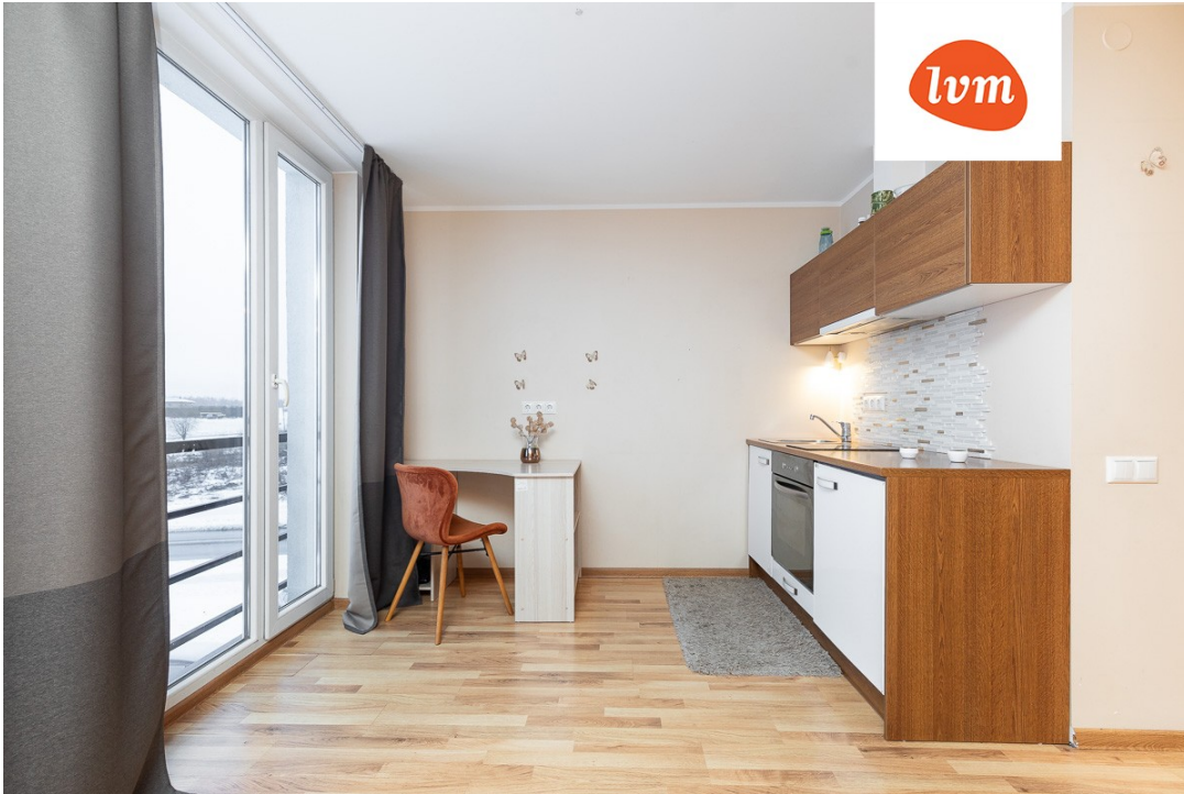
Rehetare tee 1